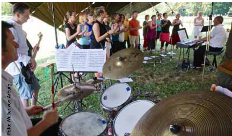
Grosser Auftritt am Unterwegs-Gottesdienst 2015.

Am 24. März findet im Kirchgemeindehaus um 20.00 Uhr eine Probe statt, die Vorprobe beginnt am Samstag um 15.30 Uhr. Bitte melden Sie sich bis 18. März an bei Vreni Flachsmann, 052 214 18 80, E-Mail: v.flachsmann@hispeed.ch.